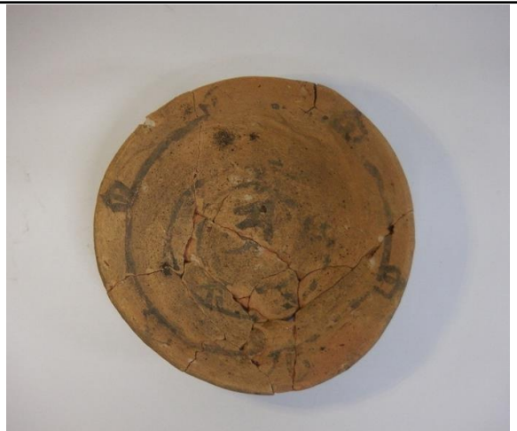
地鎮に用いられたと考えられる輪宝墨書土器