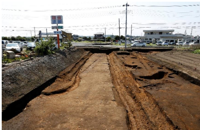
両側に側溝が掘られた道路跡