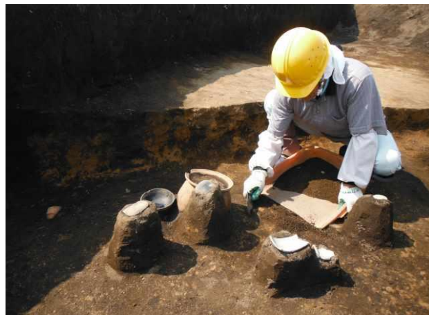
竖穴建物跡の調査