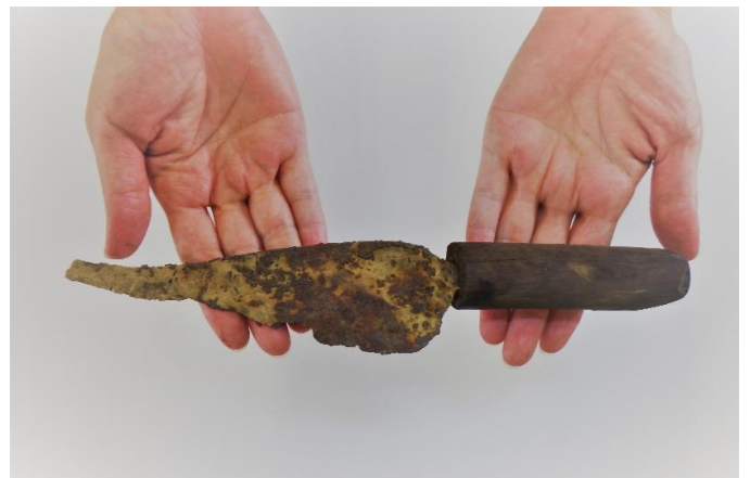
木製の柄が残った状態で出土した包丁