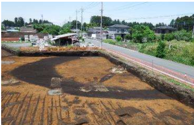
確認できた周溝と石室