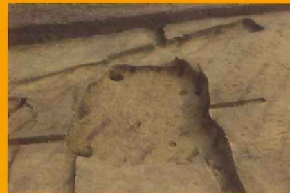
縄文時代中期の竪穴建物跡