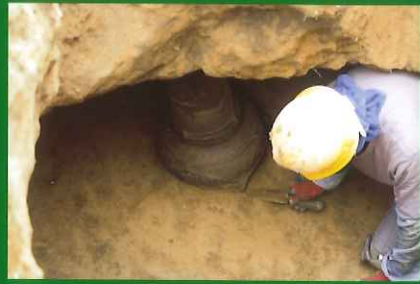
縄文時代中期の袋状土坑の調査