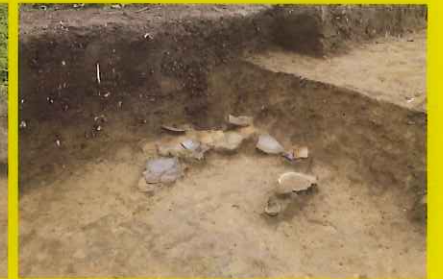
床面から壊れた状態で出土した罎や高坏