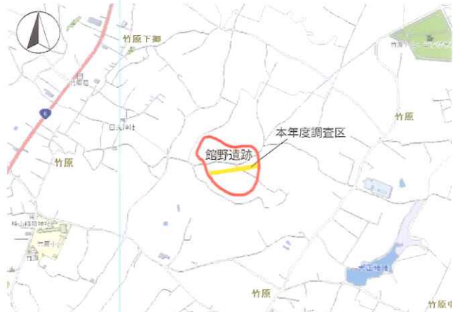
館野遺跡の位置（『茨城県デジタルマップ』より）

今回の調査で縄文時代中期と古墳時代の集落跡の一部を確認できました。縄文時代中期の集落構造の特徴は、貯蔵用の袋状土坑が調査区東側を中心に、住まいの竪穴建物が調査区西側にまとまって構築されていることです。こうしたことから、集落の広がりや各施設の配置を知る手がかりが得られました。また、古墳時代の集落跡は大きく2時期に分かれ、当地が居住拠点として断続的に利用されてきたことが分かりました。今回の調査した範囲は道路幅のため狭く、各時代の集落跡の全貌は不明ですが、小美玉市域の原始古代の歴史や暮らしぶりを考える上で貴重な資料が得られました。