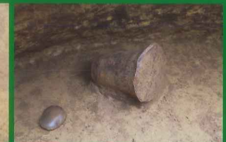
底面に横たわる深鉢と敲石