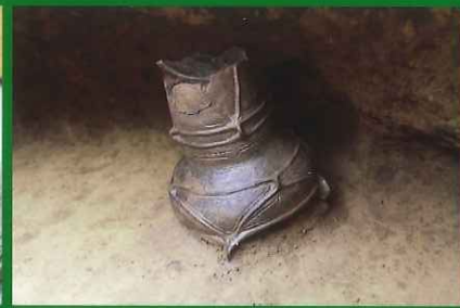
底面から倒立して出土した深鉢