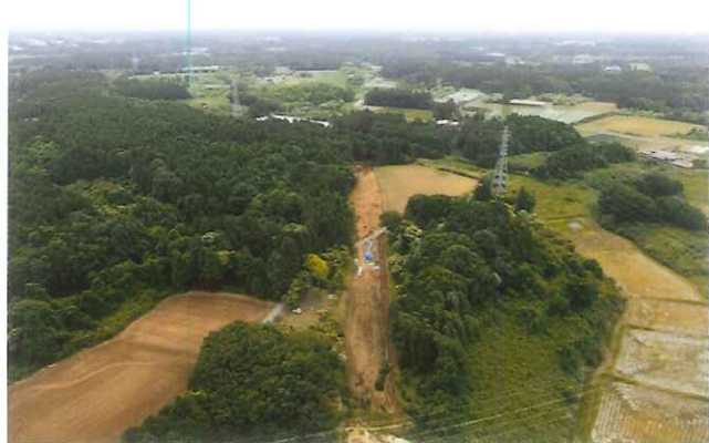
館野遺跡を西から望む（写真の奥に茨城空港）