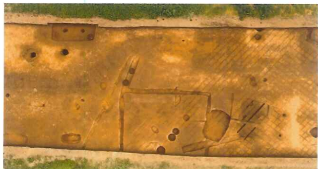
調査区東側の竪穴建物跡や袋状土坑

この資料は、調査中の情報であり、最終的な結果ではありません。資料の引用・掲載はご遠慮願います。