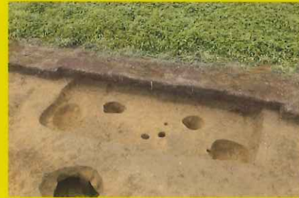
古墳時代前期の竪穴建物跡