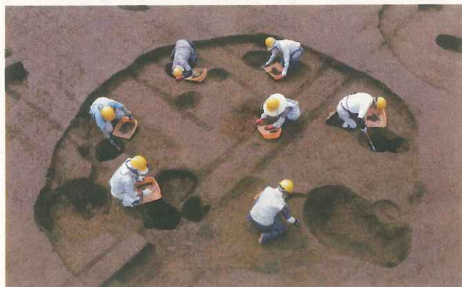
竪穴住居跡の発掘調査 (第 3 号竪穴住居跡)

今回の調査では、竪穴住居跡約 30 棟、土坑約 500 基などを確認し、縄文時代中期末葉から後期初頭 (約 4,000 年前) にかけて営まれた集落跡であることが分かりました。竪穴住居跡は、径 3～6 m の円形で、中央部には炉が設けられています。炉の形状は様々で、床と同じ高さのもの、床を掘りくぼめたもの、底を打ち欠いた土器が埋められたものなどが確認できました。また、土坑のなかには円筒形をしたものがあり、径 2 m、深さ 1.5 m の大形のものも見られ、貯蔵穴として使われたと考えられます。主な出土遺物は、煮炊きに用いられた縄文土器やドングリなどをすりつぶした磨石と石皿、土の掘削や木の伐採に使われた打製石斧と磨製石斧、動物や魚を捕るために使われた石の鎌や錘などです。また、ヤマトシジミの貝殻がまとまって出土しており、当時、集落の周辺に真水と海水とが入り混じる水域があったことが分かりました。