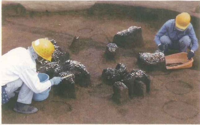
竪穴住居跡に捨てられたヤマトシジミの貝殻 (第24号竪穴住居跡)