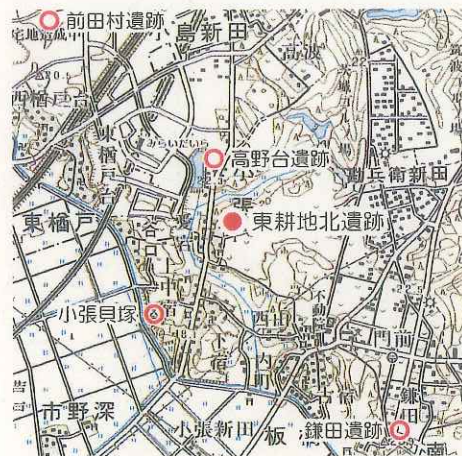
遺跡位置図 (国土地理院 5 万分の 1 「龍ヶ崎」)

東耕地北遺跡は、つくばみらい市の中央部、西谷田川と小貝川の支流である中通川に挟まれた標高約 20m の台地上に立地しています。当遺跡周辺の縄文時代の遺跡としては、前期から晩期にかけての大規模集落跡である前田村遺跡をはじめ、前期の田村貝塚、後期の小張貝塚、早期から中期の土器片が出土した高野台遺跡、中期の貯蔵穴が確認された鎌田遺跡などがあり、当時、内海であった小貝川の低地を望む台地の縁辺部に遺跡が点在しています。