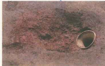
底を欠く縄文土器が埋められた炉