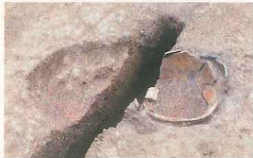
縄文土器の胴部片が埋められた炉 様々な形状の炉