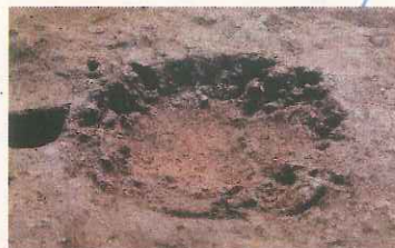
床を掘りくぼめて使用された炉