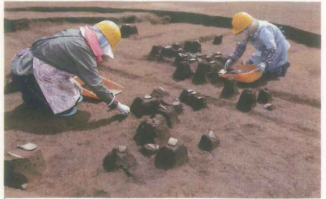
縄文土器の検出作業 (第3号竪穴住居跡)