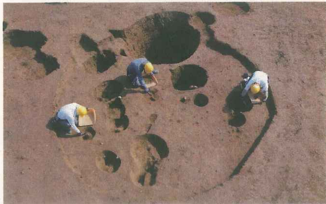
竪穴住居跡の発掘調査 (第 10 号竪穴住居跡)