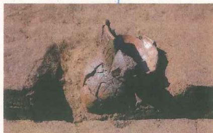
完全な形のまま埋められていた 縄文土器の深鉢 (第145号土坑)