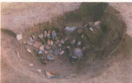
多量の縄文土器の破片が出土した土坑 (第211号土坑)