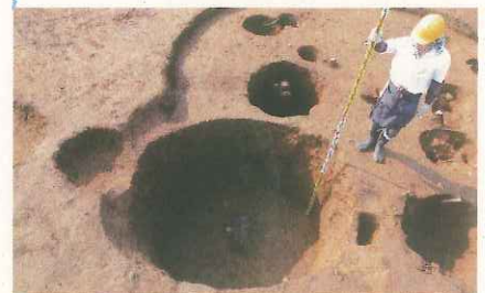
深さ1.5mの円筒形の土坑 (第49号土坑)

この資料は、調査中の情報であり、 最終的な結果ではございませんので、 引用・掲載はご遠慮願います。