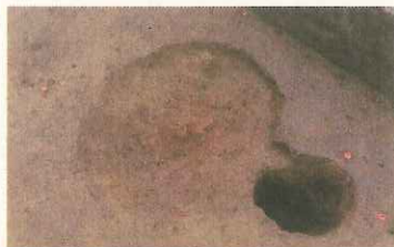
床と同じ高さで使用された炉