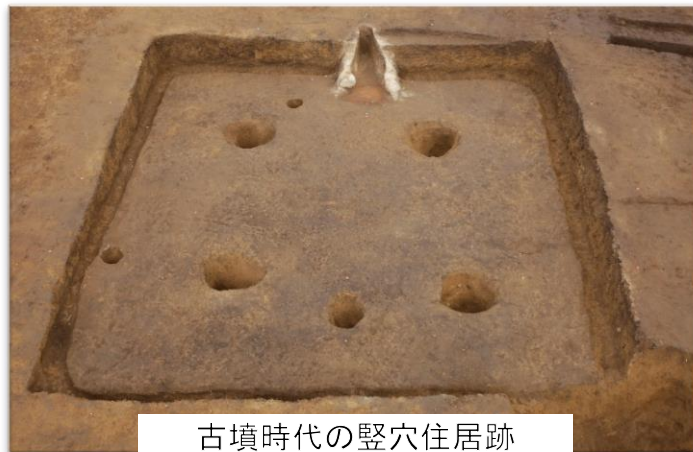
古墳時代の竪穴住居跡