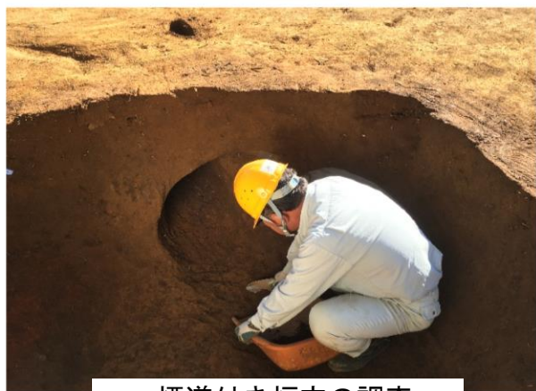
煙道付き炉穴の調査