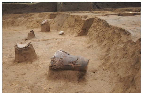
第36号竪穴建物跡(上)と横たわる縄文土器(下)