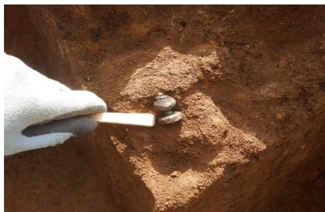
第3号方形竪穴遺構から出土した「榿」