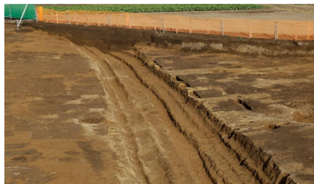
第1号道路跡と 何度も掘り返された側溝跡