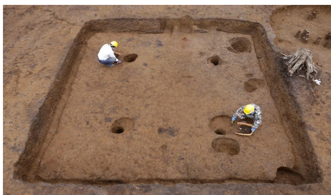
古墳時代の竪穴建物跡の調査