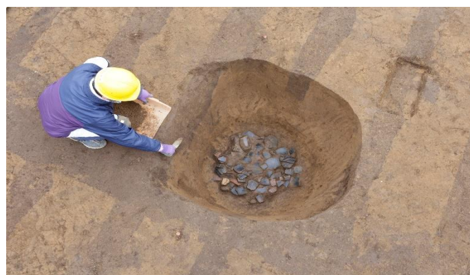
縄文土器がたくさん出土した円筒状土坑