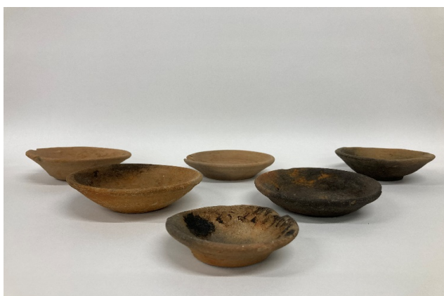
堀跡から出土した土器