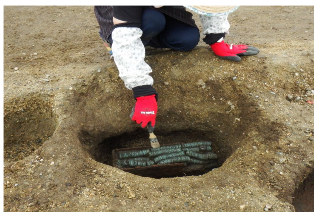
木箱に収められた大量の埋納銭