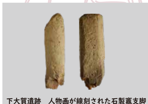
下大賀遺跡 人物画が線刻された石製竈支脚