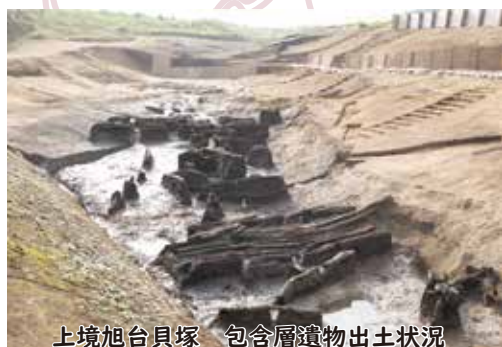
上境旭台貝塚 包含層遺物出土状況