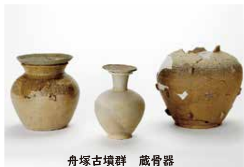
舟塚古墳群 蔵骨器