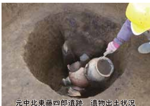
元中北東藤四郎遺跡 遺物出土状況