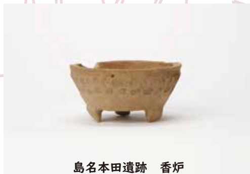
島名本田遺跡 香炉