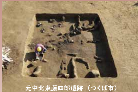
元中北東藤四郎遺跡（つくば市）