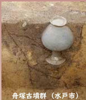
舟塚古墳群（水戸市）