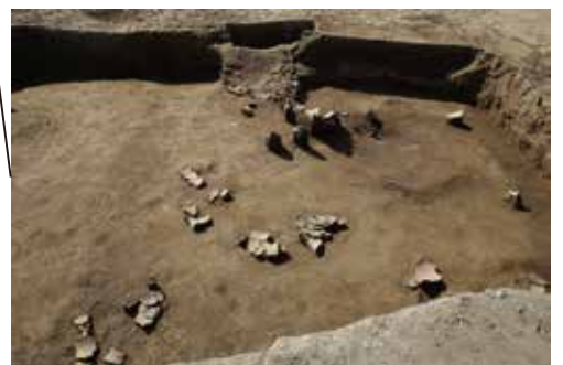
床面から多くの土器が出土した竪穴建物跡