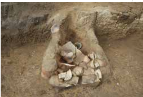
竈から多くの土器が出土した竪穴建物跡