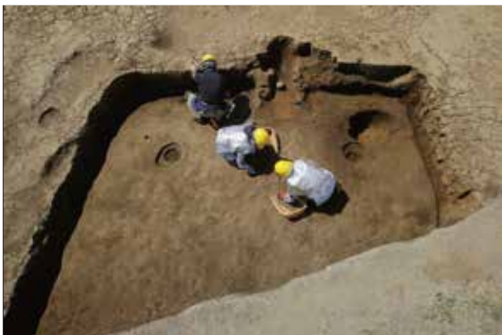
竪穴建物跡の調査