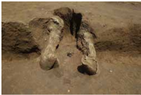
竈の補強材に土器を使用した竪穴建物跡