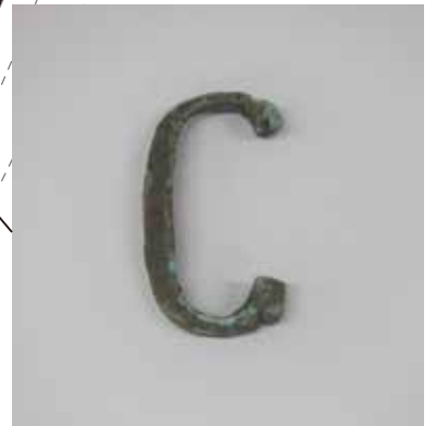
出土した腰帶具（鉸具） かこ