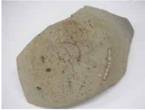
「中」と墨書された須恵器坏（底部外面）