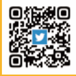
X (旧 Twitter)