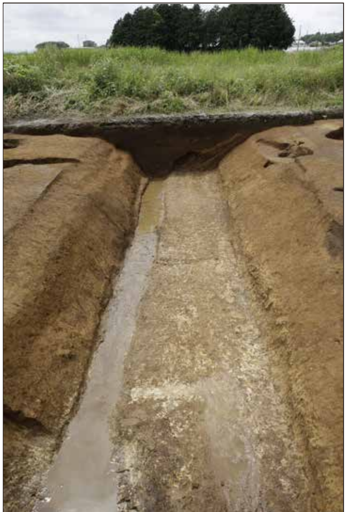
東西方向に延びる堀跡 (調査区北部)