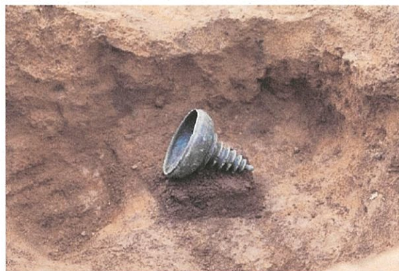
出土した塔錠形合子（とうまりがたごうす）