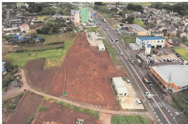
中道南遺跡の近景（南から）